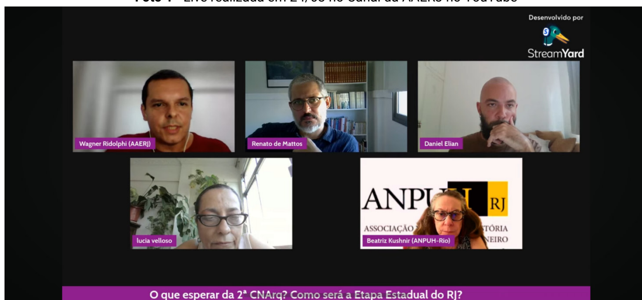
Foto 1 - Live realizada em 24/03 no Canal da AAERJ no YouTube