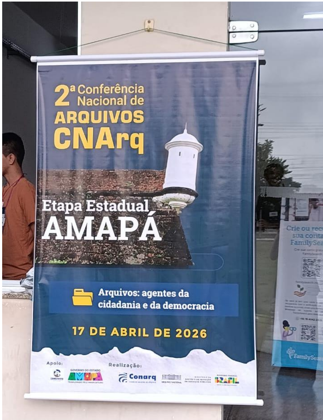
Foto 1 – Banner da Etapa Estadual na entrada do Auditório da Pós-Graduação/UNIFAP