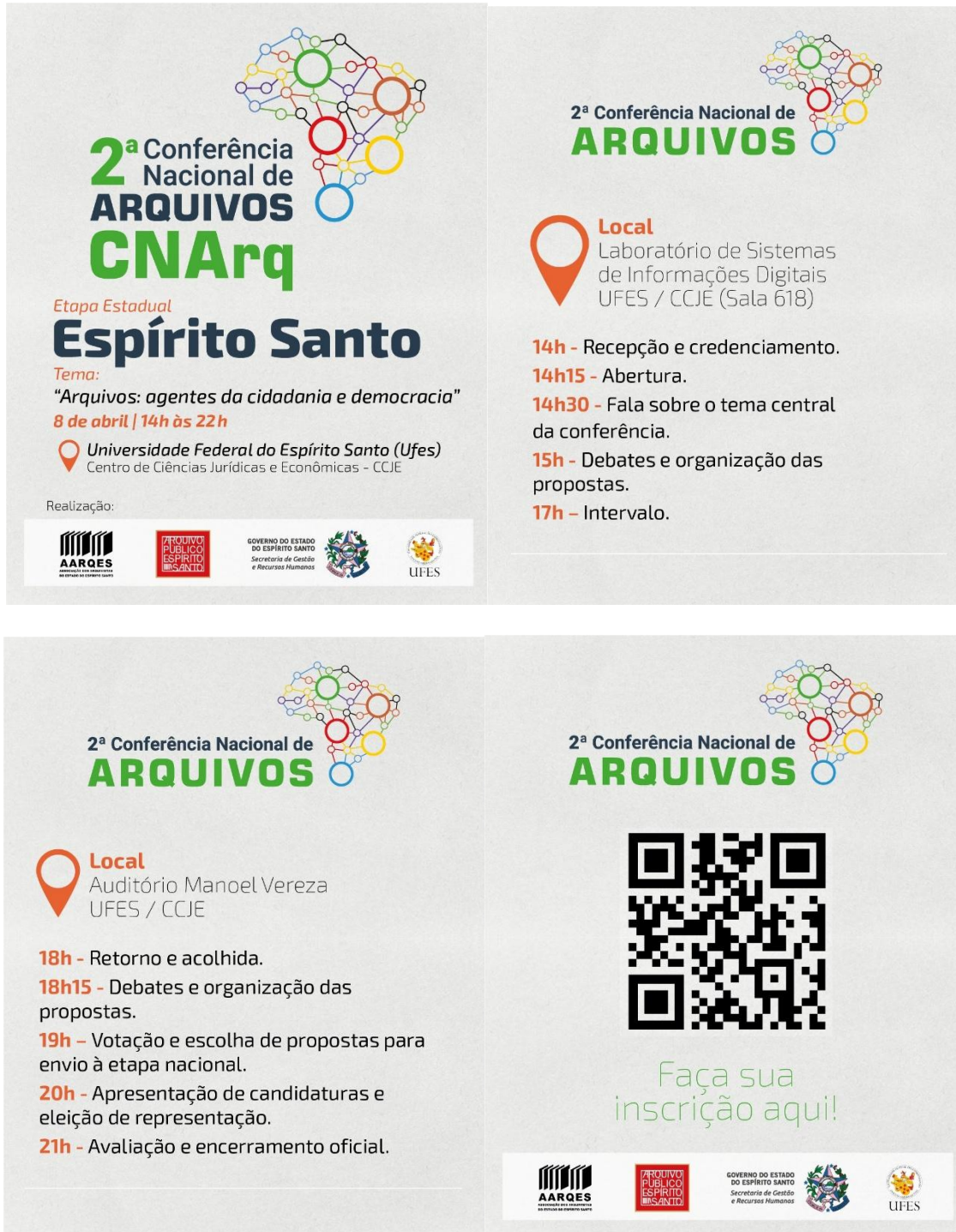
Figura 1 – Card de divulgação para as redes sociais

Inclua aqui fotos e materiais de sites, blogs e da mídia a respeito da etapa realizada.