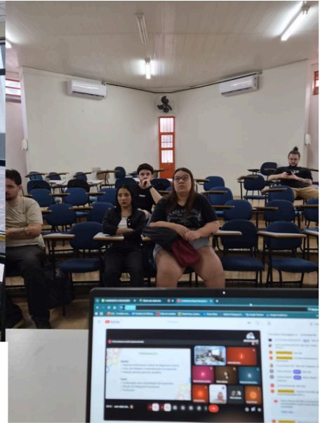
17/04/26 - Palácio das Araucárias (Curitiba) - presencial