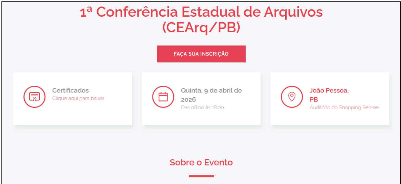
Figuras 3 e 4 - Divulgação do evento nas redes da APEPB e da AAPB