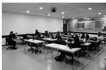
Grupos de trabalho reúnem-se no Shopping Sebrae

Organizado pelo Arquivo Público do Estado da Paraíba (Apepb) e pela Associação dos Arquivistas da Paraíba (AAPP), com patrocínio da Empresa Paraibana