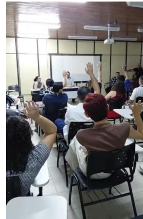
Imagens 21 e 22 – Encerramento da Plenária e os Delegados Eleitos para representar o Amazonas na Etapa Nacional.